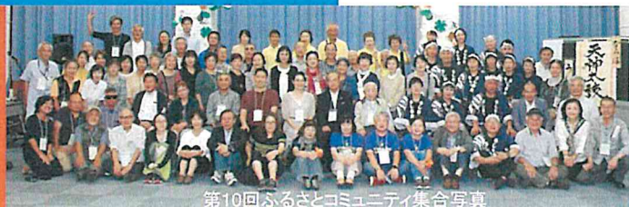
第10回ふるさとコミュニティ集合写真

ふるさとの仲間と楽しいひとときを、 一緒に過ごしませんか? 皆さまのご参加お待ちしております