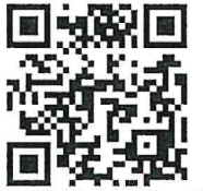
宛先アドレスのQRコード

お申し込み内容確認のため、返信させていただくことがあります。迷惑メールフィルターご利用の場合、当アドレスが受信できるよう設定をお願いいたします。